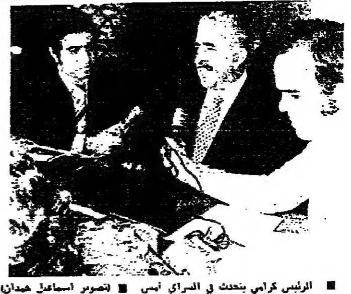
الرئيس كرامى يتحدث في الراي امسي